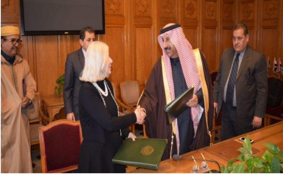
الدكتور صالح التويجري مع السفيرة الدكتورة هيفاء أبوغزالة الأمين العام المساعد رئيس قطاع الشؤون الاجتماعية بالجامعة العربية عقب توقيع مذكرة تفاهم بين المنظمة العربية وجامعة الدول العربية لتنسيق العمل الإنساني خصوصا ما تعلق بمواجهة الكوارث في 12 يناير، 2020 م.