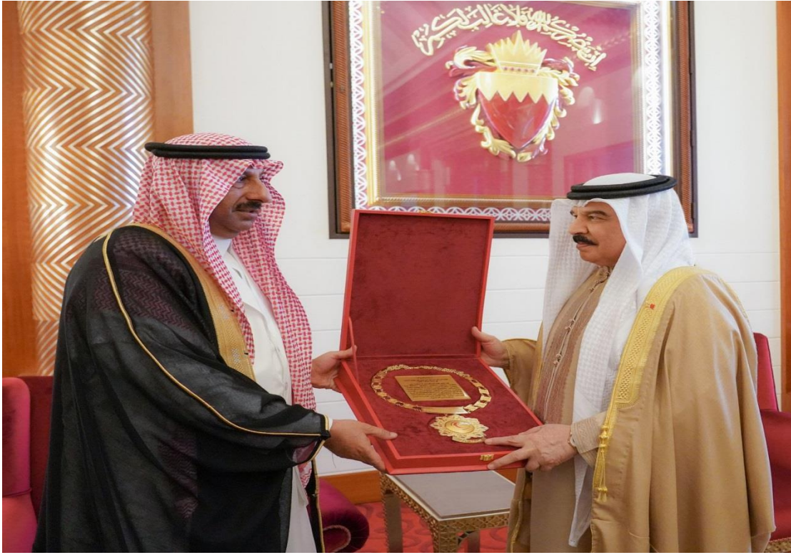
الدكتور صالح التويجري وهو يسلم قلادة "أبو بكر الصديق" من الطبقة الأولى للملك حمد آل خليفة ملك مملكة البحرين تقديراً لجهوده الإنسانية بتاريخ 30 ديسمبر 2021م