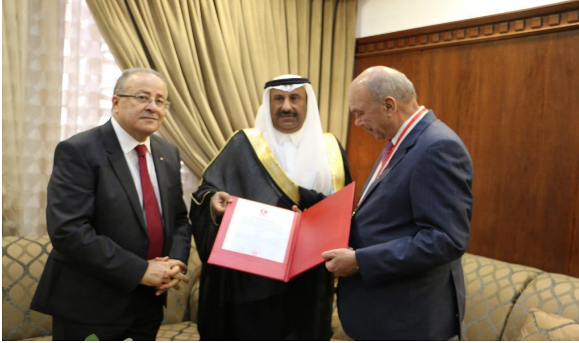
تقليد دولة الأستاذ فيصل عاكف الفايز رئيس مجلس الاعيان الأردني قلادة أبي بكر الصديق (رضي الله عنه) بحضور الدكتور محمد الحديد رئيس جمعية الهلال الأحمر الأردني في 23 مايو، 2019