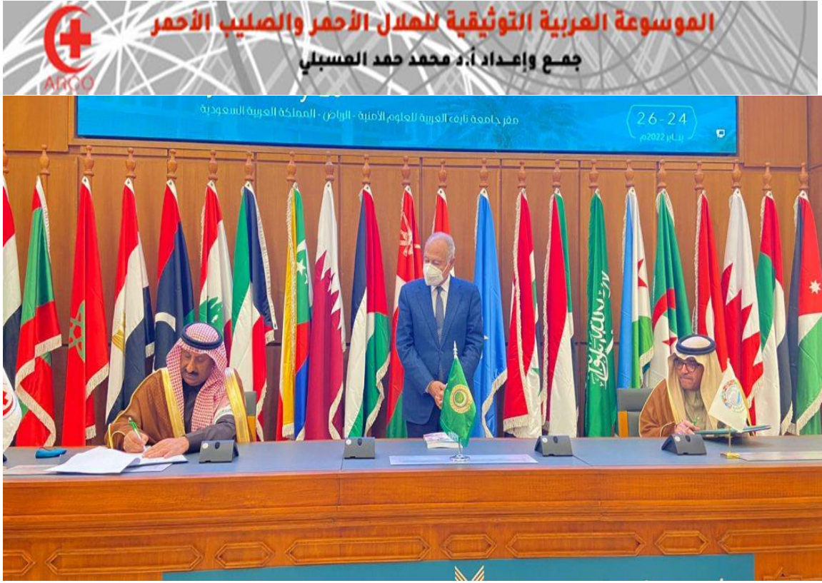
توقيع مذكرة تفاهم بين المنظمة العربية للهلال الأحمر والصليب الأحمر والمنظمة العربية للسياسة 26 يناير 2022 م